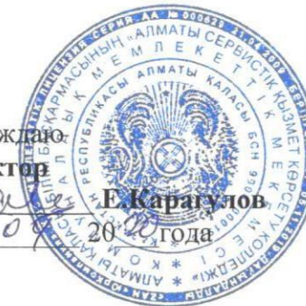
ГРАФИК проведения промежуточной аттестации обучающихся на 2019- 2020 учебный год в on-line режиме